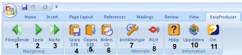
Bild föreställande EasyProducer som en del av menyfliksområdet i Microsoft Word 2007.

EasyProducer installeras som ett instickprogram i Microsoft Word och kan inte köras fristående. Förutsatt att EasyProducer är installerad på datorn så dyker EasyProducer upp som ett alternativ i menyfliksområdet eller menysystemet beroende på vilken version av Word du har installerad på din dator.